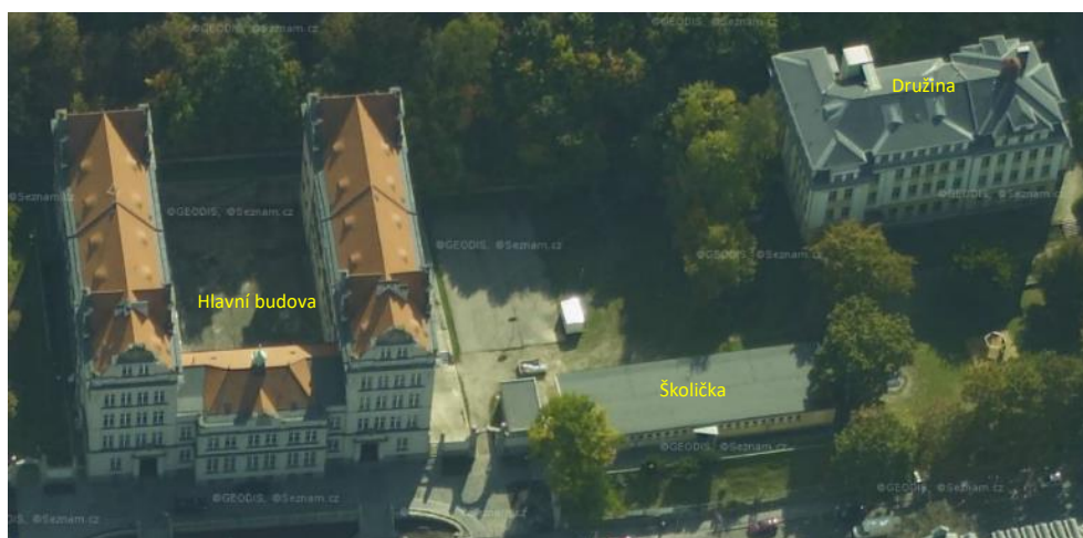
Areál Základní školy Dukelských hrdinů

Veškerá nová kabelizace (optické i metalické vedení) v levém křídle hlavní budovy tak bude realizována v trubkách a uložena do lišt, aby mohly být rozvody při následně plánované rekonstrukci uloženy pod omítku.